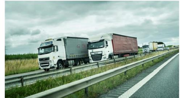
Lastbilar som väntar på A-åren mellan Malmö och Helsingborg.