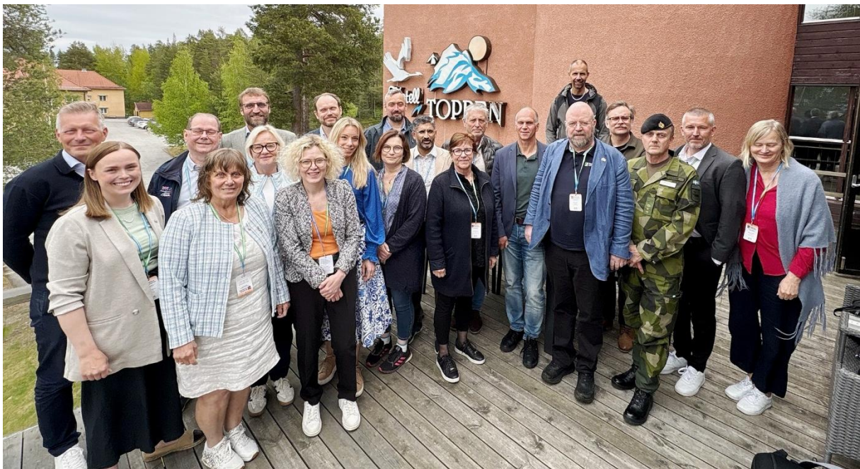
Deltagare vid Business Meetpoint och MidtSkandias årsmöte i Storuman.

Dessa arenor har också varit viktiga för att stärka relationer, kunskapsutbyte och samverkan mellan aktörer i gränsregionen. Arbetet bidrar långsiktigt till regionens attraktivitet och till möjligheten att leva, arbeta och verka över landsgränserna.