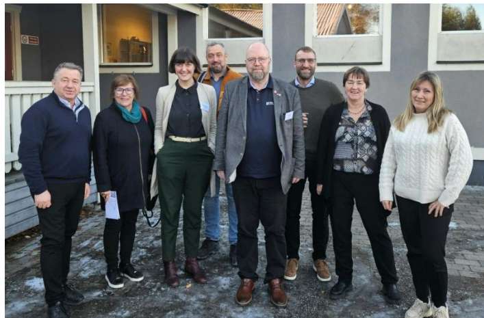
Deltagare från Norge vid Grenseforum och MidtSkandias höstmöte.

MidtSkandias perspektiv presenterades gemensamt av presidiet och efterföljdes av en konstruktiv dialog där både svenskt och norskt perspektiv på stråket lyftes.